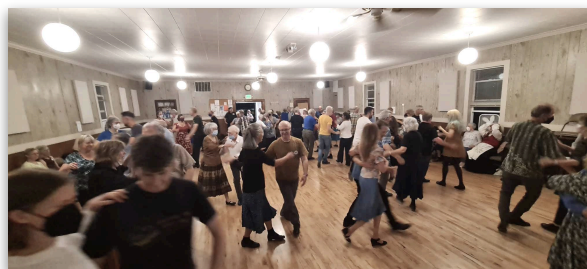
Klintetten spelar till danskurs i Seattle.