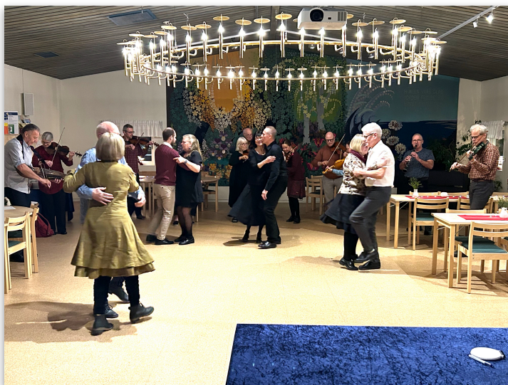
Allspel och dans.