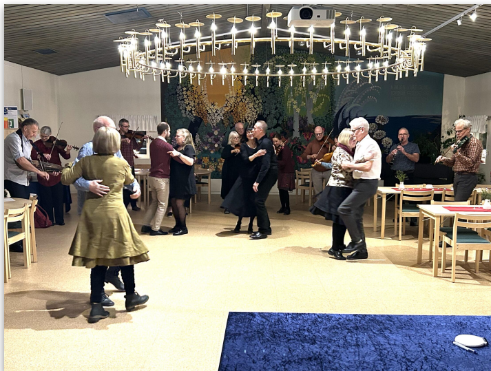
Allspel och dans.