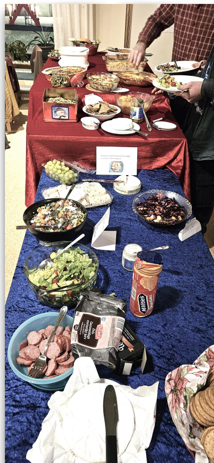
Mycket mat på Knytkalaset.