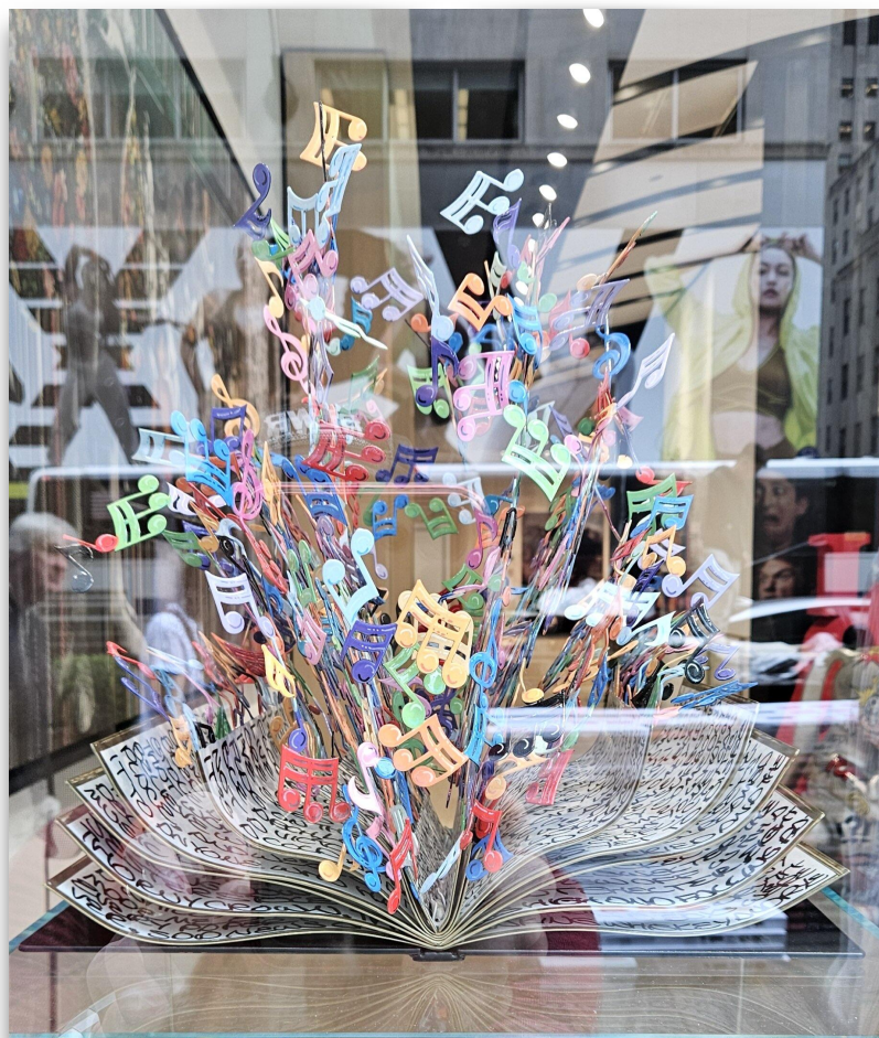
Noter i New York.