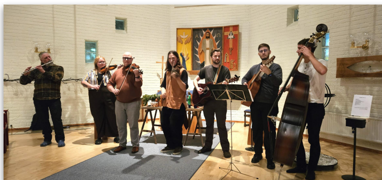
Konsert med Norrköpings Folkmusikorkester.