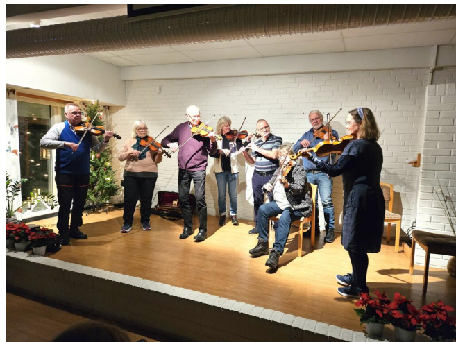
Folklekarne spelar.