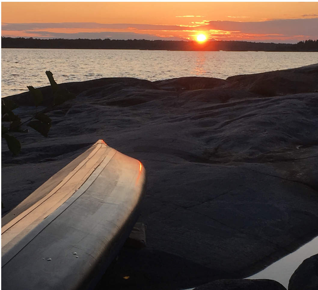
Sensommarkväll med solnedgång från Hälsingeholmen, Gryts Skärgård.