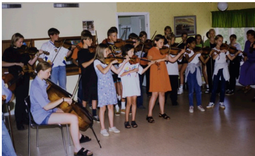
Förr i världen... Läger på KFUM gården vid Rängen 1995

Antalet deltagare har naturligtvis varierat, 10-15 i början och antalet växte sedan till runt 40 i mitten på 90-talet. 2017 års läger hade 55 deltagare! Siffrorna visar att intresset var och är stort, lägren skapar stor gemenskap mellan ungdomarna och det var alltid tårdrypande avsked då man skingrades sista dagen efter avslutningskonserten. Det var även gläd-