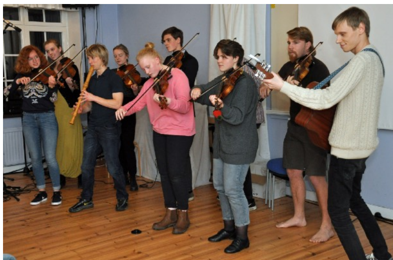
Nedan: ÖsUpp spelade friskt, fartigt och med fläkt.