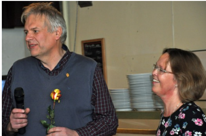
... för att ta emot förtjänstecken för sitt 25-åriga arbete med ÖSF:s arkiv.