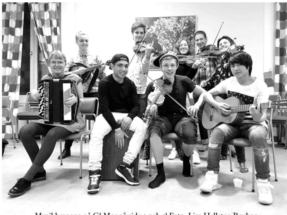
Musikbryggan på G! Mer på sida 2 och 3!