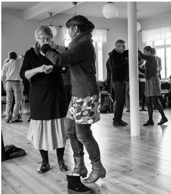
Dans i Borghamn så att skorna för all världens väg...