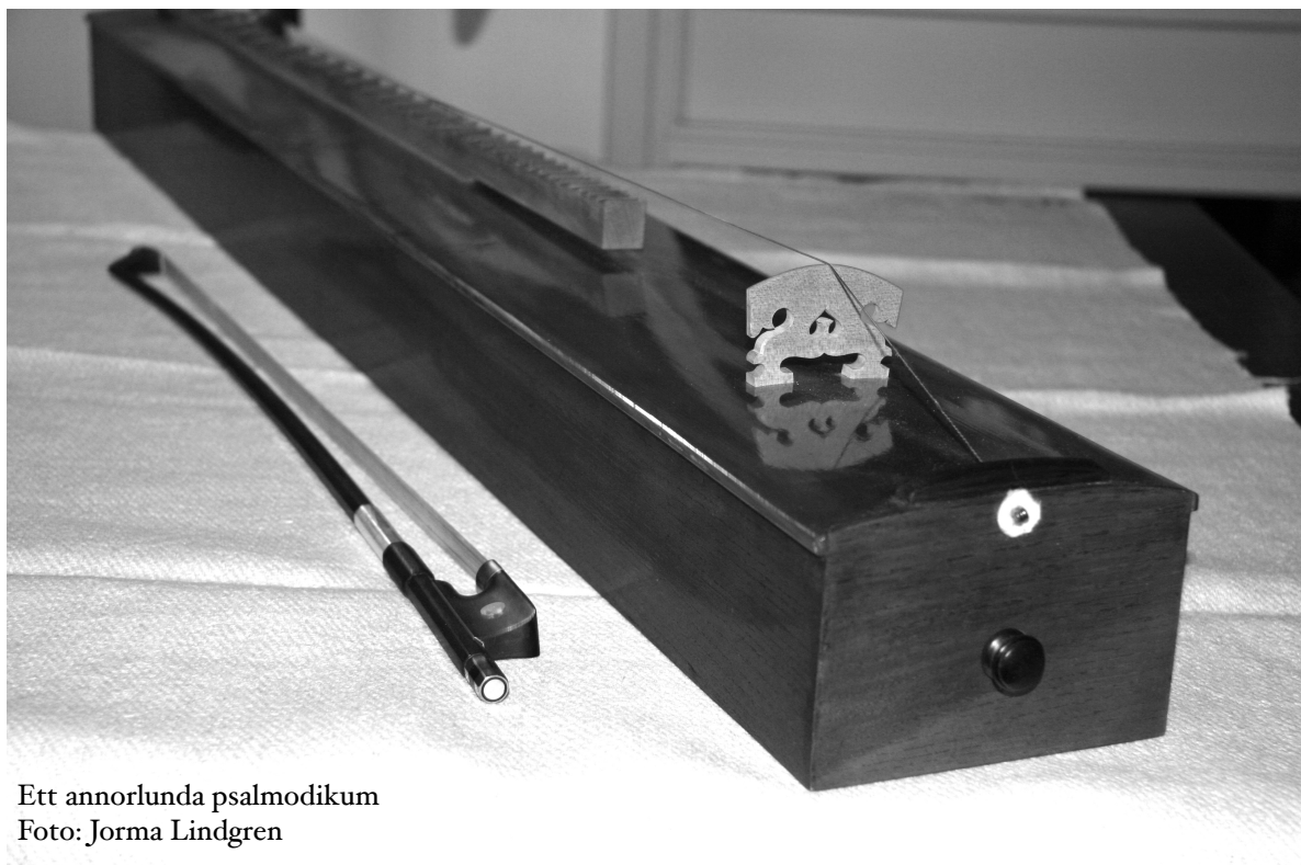
Ett annorlunda psalmodikon