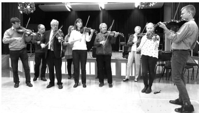
Till vänster: Linköpings spelmanslag