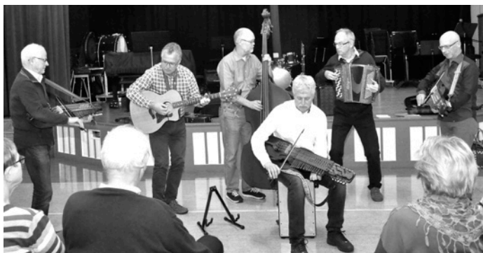
Till vänster: Filidur Nedan: Hans grupp