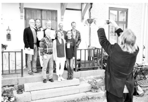
Till höger: Glada pristagare fotograferas