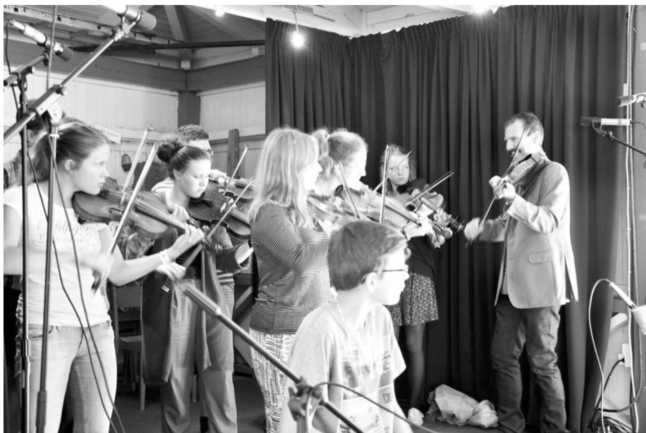
ÖsUpp konserterade på dansbanan