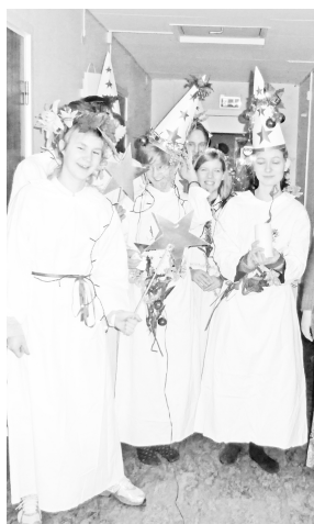
Ett annorlunda Luciatåg...

Ju längre läsåret fortskred desto lättare fick jag att hänga med och till min stora förtjusning märkte även ungdomarna att mitt spel förbättrades.