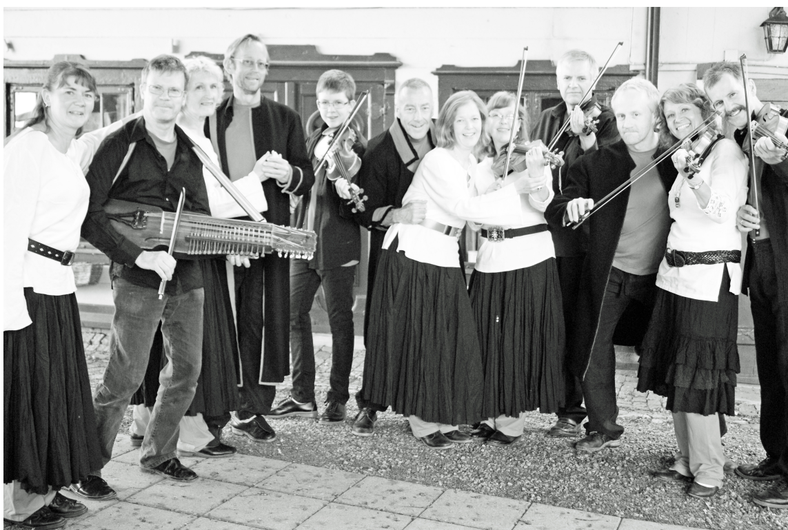
Klintetten. Affisch- bild