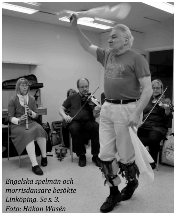
Engelska spelmän och morrisdansare besökte Linköping. Se s. 3.

God Jul och Gott Nytt År önskas alla medlemmar!