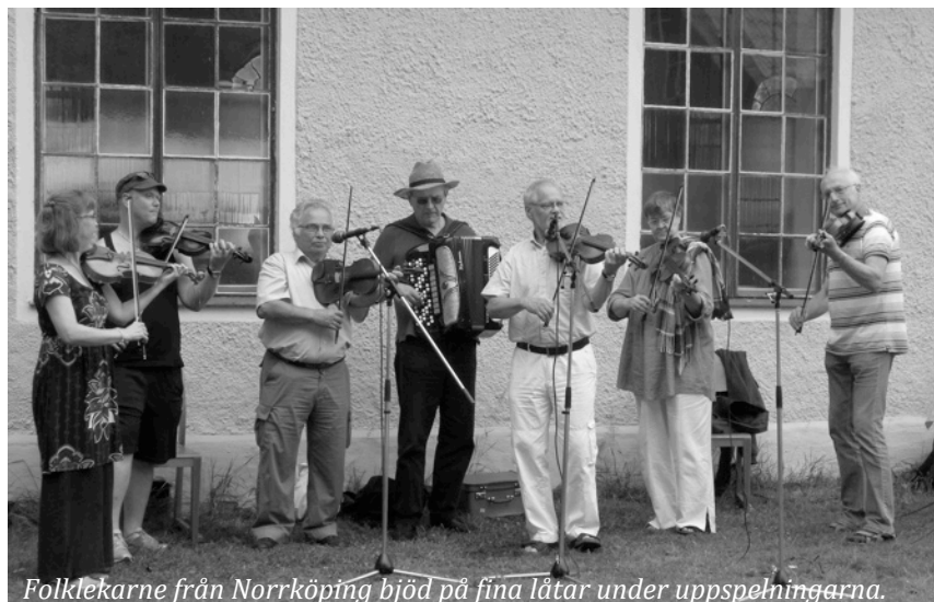
Folklekarne från Norrköping bjöd på fina låtar under uppspelningarna.