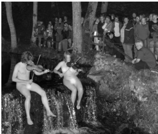
Näckspel och bäckspel i Degeberga. Här dock återgivna utan namn...