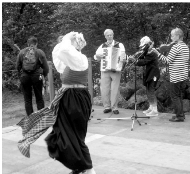
Det gällde att hålla i hatten för det blev blåsigt i Vånga.