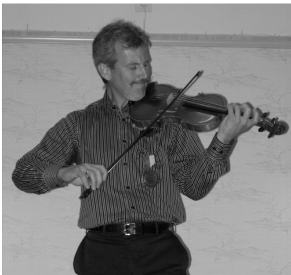
Glad soloklassvinnare drar en vinnarlåt.

Uppdraget ansåg juryn var svårare i år än förra året men efter diskussion i enrum rangordnade de enhälligt deltagarna så här – rättvist var nog den allmänna meningen: