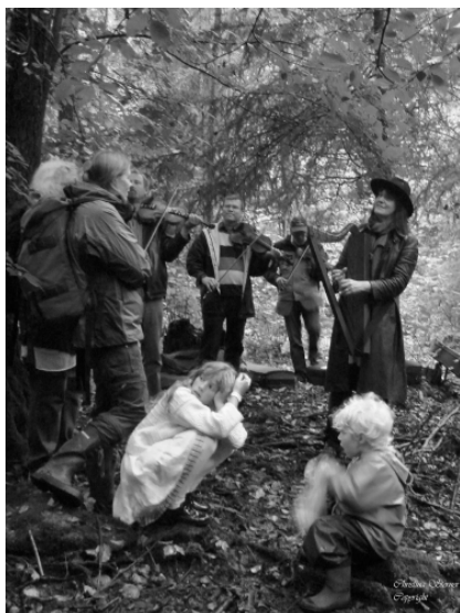
Spel vid trefaldighetskällan i Slaka under stämman 2008.

Alldeles utanför Linköping men ändå på landsbygden ligger Slaka med sin gamla by, sitt omskrivna säteri, nya och gamla Slaka och sin digra folkmusikskatt.