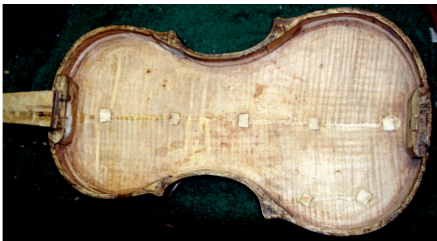
Med "frimärke" efter "frimärke" över sprickorna i botten har livet upprätthållits på den gamla fiolen byggd av en okänd för länge sedan.